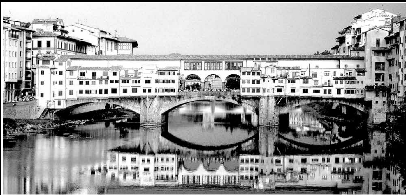
Ponte Vecchio - Florence